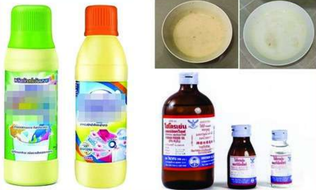
ประสิทธิภาพและชื่อทางการค้าของน้ำยาทำลายเชื้อที่ใช้ในโรงพยาบาล ในประเทศไทย (อะเคือ อุณหเลขกะ)

หน่วยบริการให้คำปรึกษาและเฝ้าระวังทางวิชาการ ในวิกฤติการณ์โรคจากการแพร่ระบาดของไวรัส COVID-19 หลักสูตรสาธารณสุขศาสตรบัณฑิต คณะวิทยาศาสตร์และเทคโนโลยี