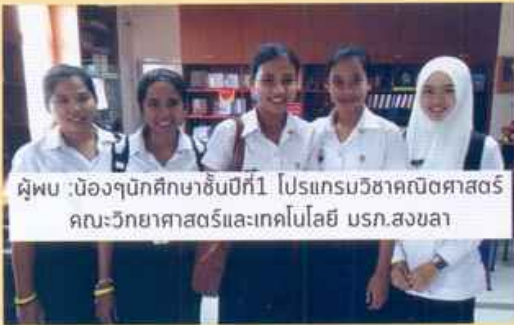
ผู้พบ บัตรประชาชนนักเรียนปี1 โปรแกรมวิชาคณิตศาสตร์ คณะวิทยาศาสตร์และเทคโนโลยี มรท.สงขลา

19 ธ.ค.59 : พบเงินสด บริเวณคณะเทคโนโลยีการเกษตร