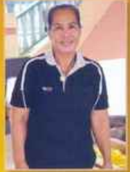
ป้าแหม่ม