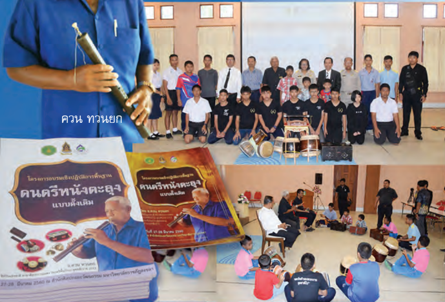
ควน ทวนยก

แบบดั้งเดิม เปิดเผยว่า ดนตรีมีส่วนสำคัญอย่างยิ่งในการพัฒนาจิตใจของเยาวชน แต่ปัจจุบันพบว่าโรงเรียนต่างๆ ขาดแคลนผู้รู้ด้านดนตรีหนังตะลุง บางโรงเรียนต้องแก้ปัญหาโดยการจ้างผู้ที่มีภูมิปัญญาท้องถิ่น หรือให้ครูประจำการที่มีความสามารถและมีความสนใจ สอนตามความรู้อันมี ซึ่งอาจไม่ถูกต้องตามแบบแผนของดนตรีหนังตะลุง ดังนั้น ในฐานะที่ตนได้รับเลือกให้เป็นศิลปินแห่งชาติ สาขาศิลปะการแสดง (ดนตรีพื้นบ้าน) มีความเป็นห่วงต่อสถานการณ์ดังกล่าว จึงมีแนวคิดที่จะเปิดรับเยาวชนและผู้สนใจ จำนวน ๕๐ คน เข้ารับความรู้เกี่ยวกับดนตรีหนังตะลุงแบบดั้งเดิม พร้อมทั้งฝึกปฏิบัติเครื่องดนตรีใหม่ ฉิ่ง ทับ กลอง ปี่ ช่วงระหว่างวันที่ ๒๗-๒๘ มีนาคม ที่ผ่านมา สำนักศิลปะฯ มรภ.สงขลา โดยได้รับการสนับสนุนงบประมาณจากกรมส่งเสริมวัฒนธรรม (กองทุนส่งเสริมวัฒนธรรม)