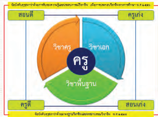
ภาพ 1 การพัฒนาครุให้เป็นวิชาชีพชั้นสูง

๑. วิชาชีพครุเป็นวิชาชีพชั้นสูง ที่ต้องพัฒนานักศึกษาครุทั้งเรื่องวิชาครุ วิชาเอก และวิชาพื้นฐาน โดยมุ่งหวังให้ได้ครุดี ครุเก่ง สอนดี สอนเก่ง ดังภาพ ๑