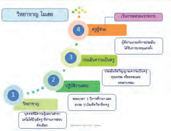
ภาพ 3 วิทยาชายู โมเดล

๓. คุณภาพการศึกษาของประเทศต้องได้รับการยกระดับด้วยเหตุที่มาจากที่ได้ผลการประเมิน O-Net, PISA แสดงให้เห็นแนวโน้มในอนาคตทางการศึกษาไทยได้อย่างชัดเจน