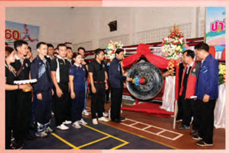
๒๒ ปารีฉัตร วารสารเพื่อการประชาสัมพันธ์ มจร.สงขลา